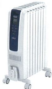
■デロンギ 「オイルヒーター」