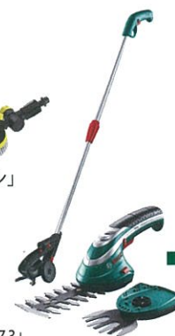
■BOSCH 「バッテリー ガーデンバリカン 延長ハンドルセット」