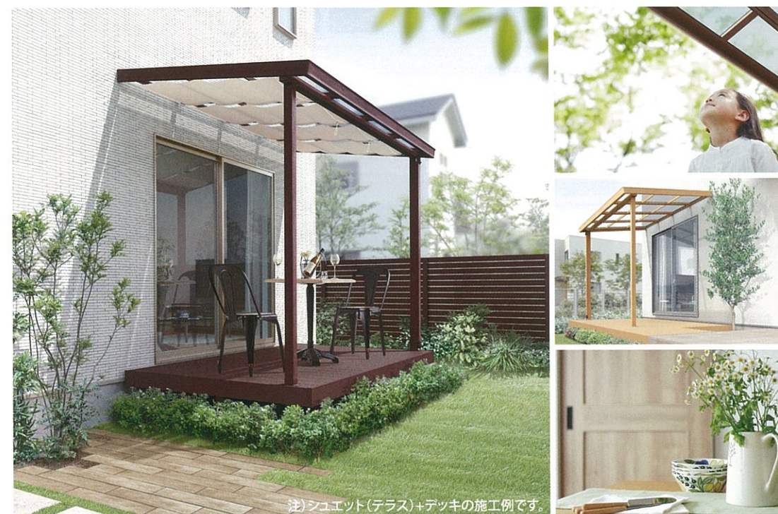
注)シュエット(テラス)+デッキの施工例です。

天然木の風合いや色味にこだわった高級感のあるテラス。 人工木デッキとのコーディネートも楽しめます。