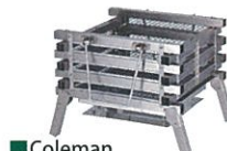
■Coleman 「ステンレスファイアース3」