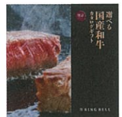
■リンベル 選べる 和牛カタログギフト 「延壽」

注) 賞品は予告なく代品に替えさせていただく場合がございます。予めご了承ください。