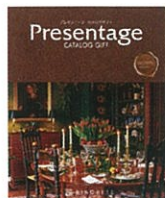
■リンベル 選べる カタログギフト 「プレゼンテージ」