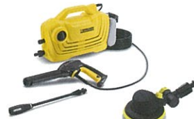
■ケルヒャー 「高压洗浄機+回転ブラシ」

対象商品 ●シュエット ●スピーネ ●サニージュ ●樹ら楽ステージ ●レストステージ